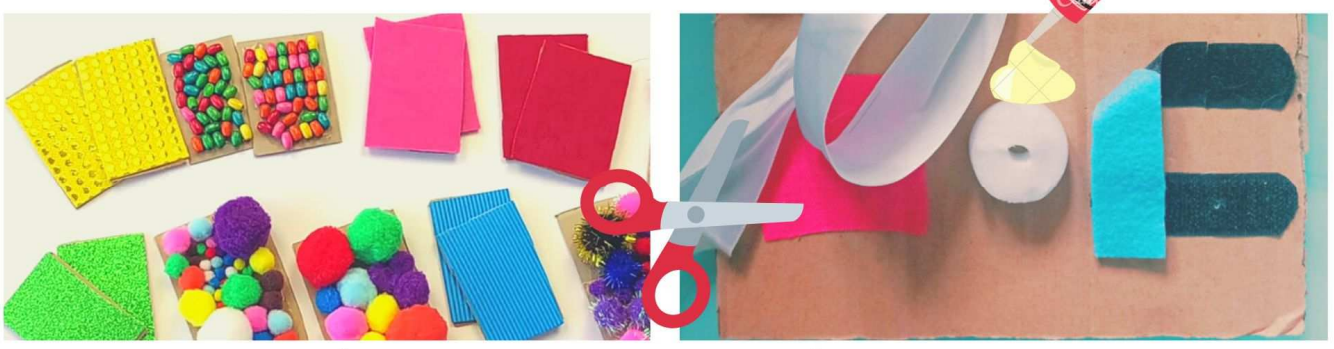
TABLA DE LOS SENTIDOS

3- ENCUENTRA ESTÍMULOS ADECUADOS 4- COLÓCALOS EN LA TABLA