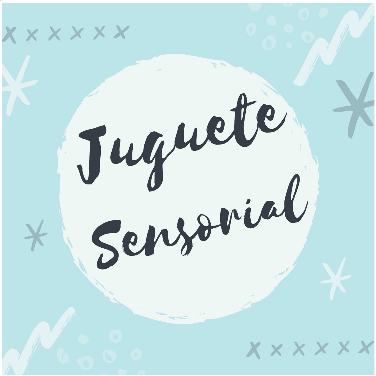
TABLA DE ESTIMULACIÓN SENSORIAL DIY